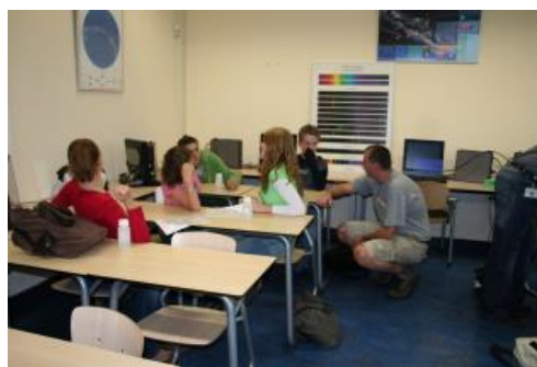
Leerlingen bespreken hoe chemisch afval afgevoerd moet worden.