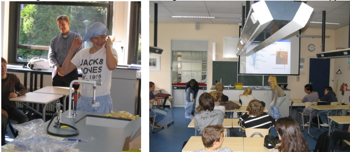
Twee leerlingen in cleanroom kleding

de cleanroom van WAG. Tevens werden de leerlingen voorzien van een aantal extra veiligheidsmiddelen zoals een veiligheidsbril, handschoenen en oordopjes.