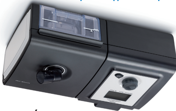
System One BiPAP Auto