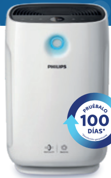
Series 2000 PURIFICADOR DE AIRE AC2887/10