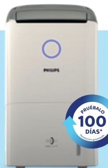
Series 5000 DESHUMIFICADOR DE AIRE DE5205/10

Vive una sensación incomparable de bienestar en el interior de tu casa.