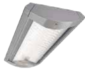
Flow LED BGP490