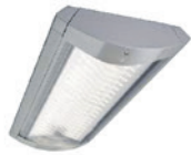
Flow LED BGP490