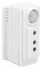
Sensor indbygget i armatur