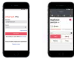
Interact Pro App