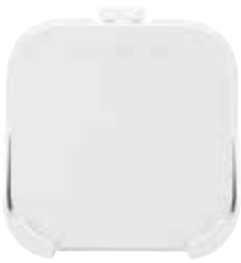
Interact Pro Gateway