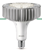
TrueForce LED HPI high-bay