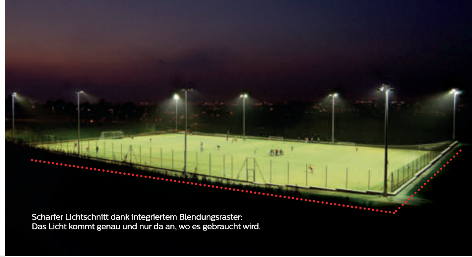
Scharfer Lichtschnitt dank integriertem Blendungsraster: Das Licht kommt genau und nur da an, wo es gebraucht wird.

Gutes Licht spielt auf Ihrem Sportplatz eine wesentliche Rolle. Ob es da eine perfekte „Strategie“ gibt? Wir sind uns sicher. Deshalb haben wir PerfectPlay entwickelt.