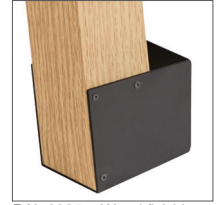
RAL 9005 + Wood finishing

L02 è una lampada LED con fissaggio esterno adatta per l'illuminazione generale indiretta in applicazioni in interni. La particolare finitura legno rende il prodotto elegante e discreto, perfettamente integrato all'ambiente in cui è installato.