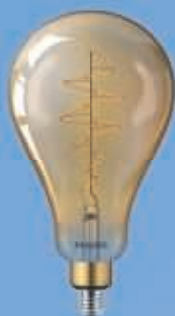
40W E27 A160 GOLD DIM