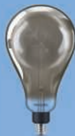
40W E27 A160 4000K smoky D