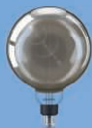
40W E27 G200 4000K smoky D