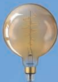
40W E27 G200 GOLD DIM