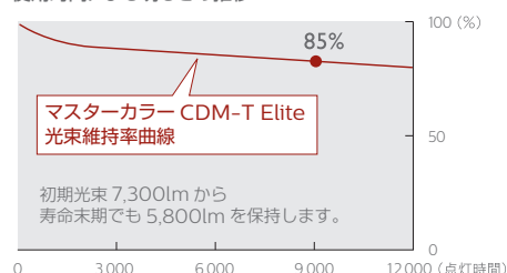
使用時間による明るさの推移