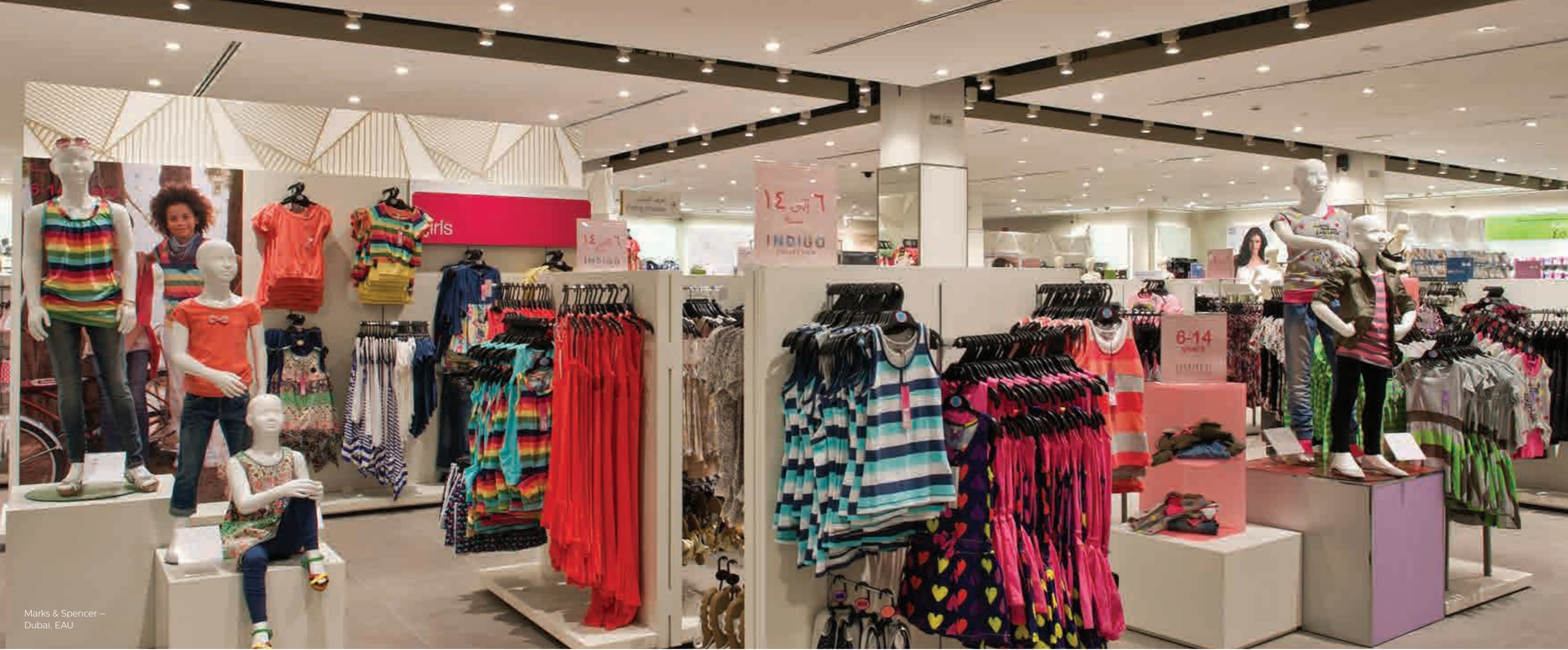
Marks & Spencer – Dubai, EAU