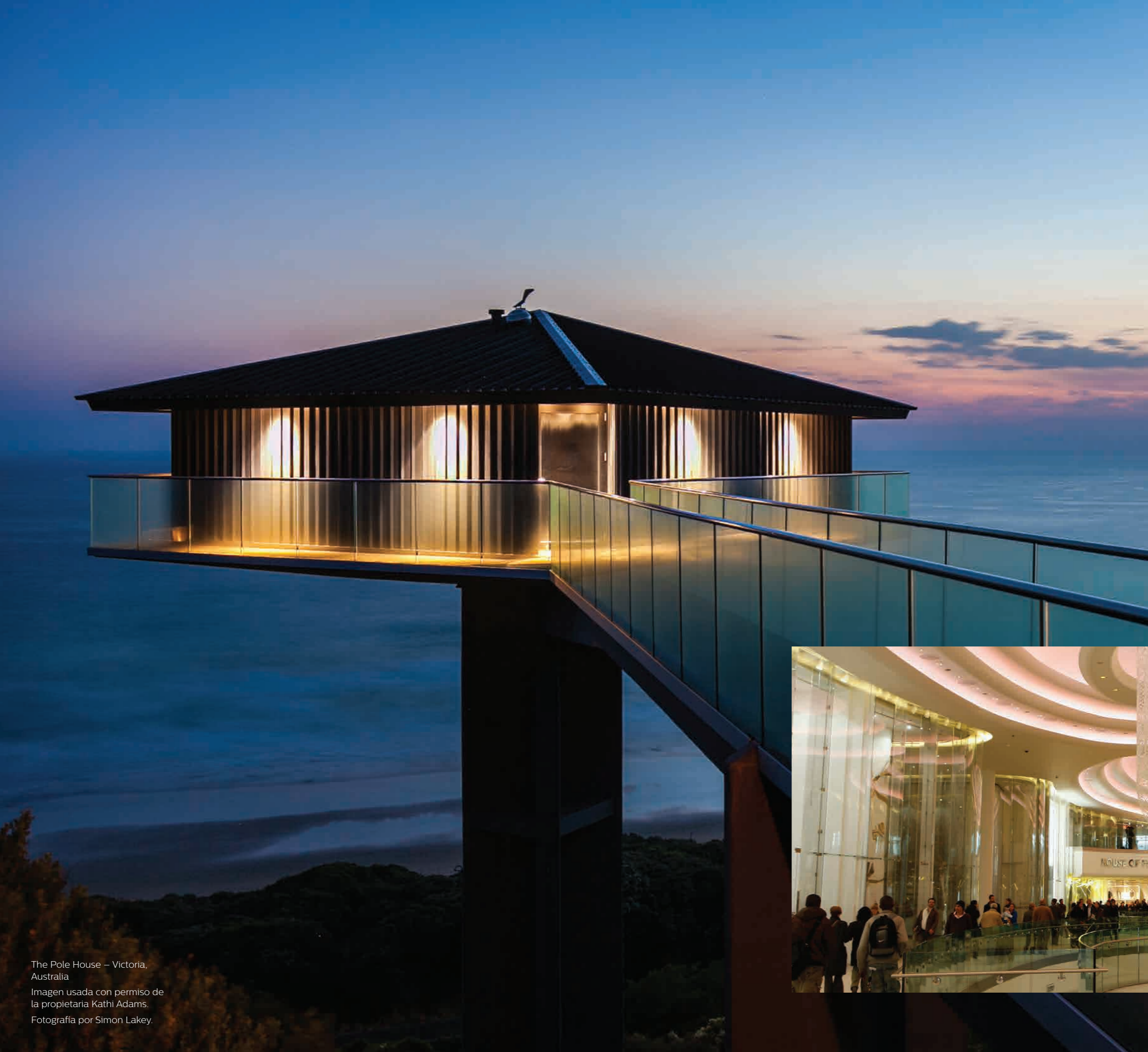
The Pole House — Victoria, Australia