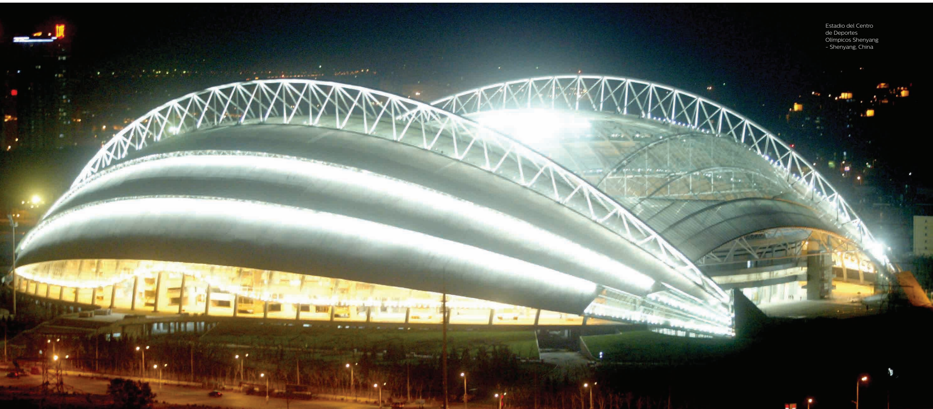
Estadio del Centro de Deportes Olímpicos Shenyang - Shenyang, China