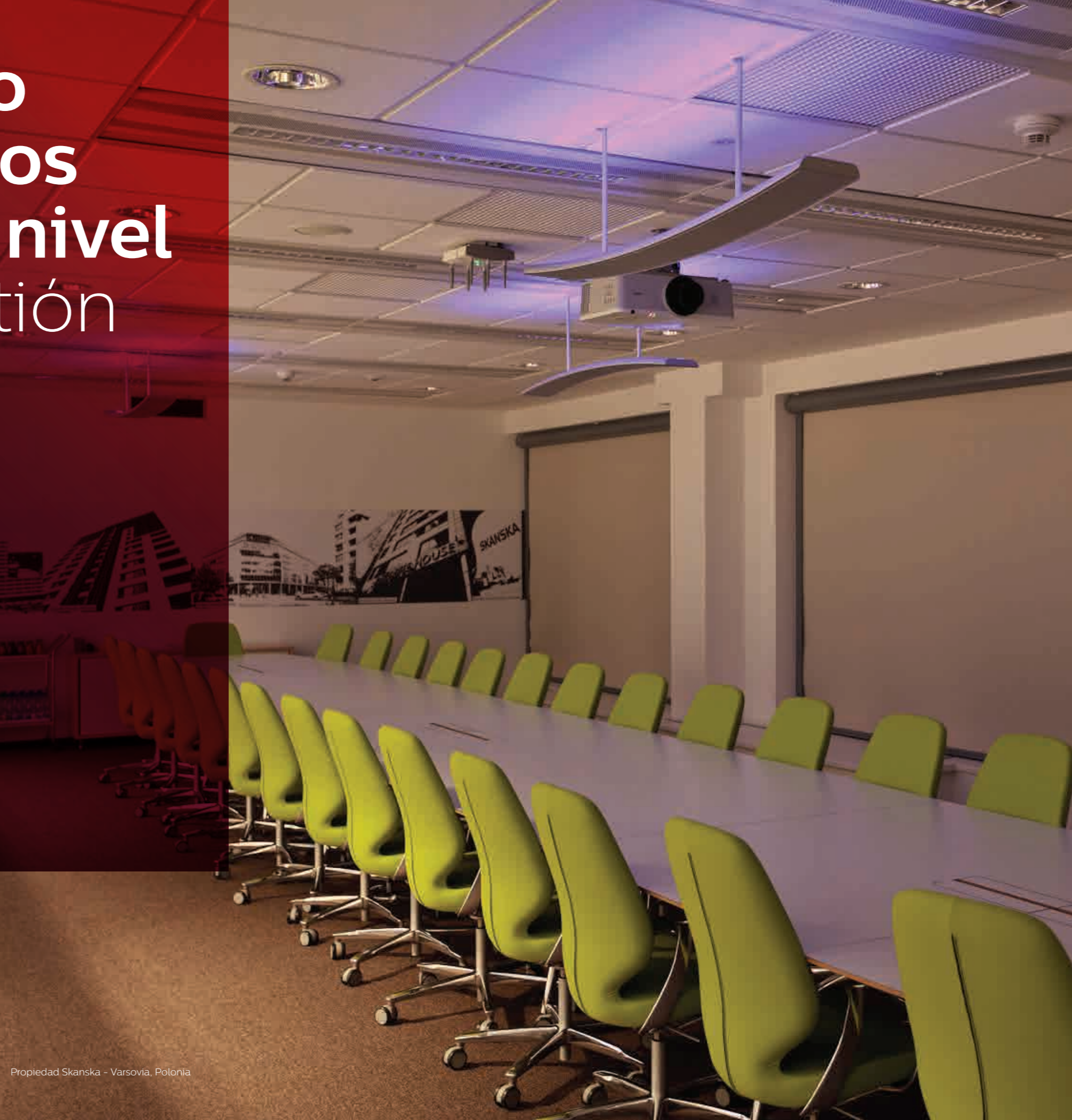
Propiedad Skanska - Varsovia, Polonia

Philips Dynalite es un experto líder en la industria en el control de LEDs de ahorro de energía, tanto para aplicaciones totalmente nuevas como de retrofit, en una amplia gama de sectores industriales. Aprovechando nuestra vasta experiencia y conocimientos técnicos, nosotros somos capaces de garantizar que la combinación resultante de protocolo de control/LED ofrezca el máximo ahorro energético, y que cubra las necesidades de iluminación del edificio, tanto ahora como en el futuro.