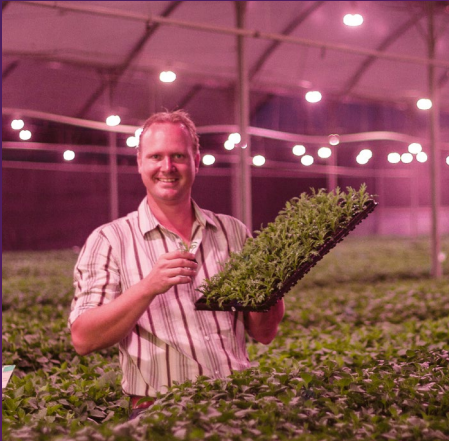
Florensis Kenya Ltd. (Perkplanten)

Aangezien licht voor telers en kwekers een belangrijk productiemiddel is, en ook bij plantenonderzoek een belangrijke factor is, voert Philips diverse praktijkproeven uit, samen met tuinbouwbedrijven en experts uit de onderzoekswereld. Deze proeven leveren waardevolle informatie voor productontwerp. Tevens tonen ze de veelzijdigheid en kosteneffectieve mogelijkheden van LED-oplossingen aan om te komen tot een optimale opbrengst en kwaliteit van het gewas.