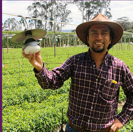
Esmeralda Farms (Snijbloemen)

“Na vier maanden werken met de LED flowering lampen werd een aanzienlijke besparing van 91% in energiekosten bereikt, wat neerkomt op een totale waarde van US$ 18.000 per jaar. Dat komt overeen met een energiebesparing van US$ 16,50/uur/hectare. Geschat wordt dat de investering in een tijdsbestek van 11 maanden zal zijn terugverdiend. De lange levensduur van de LED flowering lampen en hun betere bestendigheid tegen water resulteerden ook in lagere arbeidskosten, omdat het niet langer nodig was om iedere dag kapotte lampen te vervangen.”