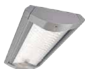
Flow LED BGP490