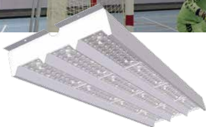
SportControl LED BCS/BPS375

Hartelijk dank voor uw interesse in dit lichtplan! Dit lichtplan geeft u een concept van hoe u met SportControl LED een sporthal kan verlichten. Bent u op zoek naar een alternatieve oplossing voor sportverlichting? Kijk voor meer informatie op www.philips.nl/standaardlichtplannen of neem contact op met uw Philips contactpersoon.