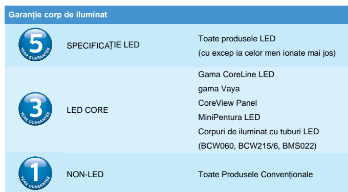
Tabelul 1: Perioada de garanție pentru Corpuri de Iluminat Profesionale de Interior Philips

Sub rezerva dispozițiilor stabilite în Termenii și Condițiile de Garan ie, Cump r torul prime te garan ie pentru perioada aplicabil , a a cum este descris în tabelul 1 i 2.