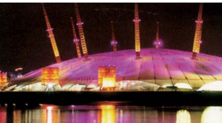
La iluminación teatral y de animación de la cúpula está controlada por el sistema de control DynaLite.

“ Con la reputación de proveedor en soluciones de iluminación innovadoras y fiables para espacios públicos exteriores, Philips fue elegida para instalar un innovador sistema de iluminación para satisfacer las exigentes demandas de este proyecto.”