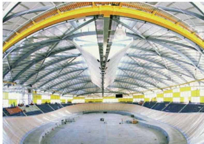
Velódromo Dunc Grey

Mediante el control de iluminación Dynalite y el software de configuración DLight, el sistema fue monitorizado remotamente por ingenieros de Philips para evitar interrupciones en la iluminación y problemas técnicos.