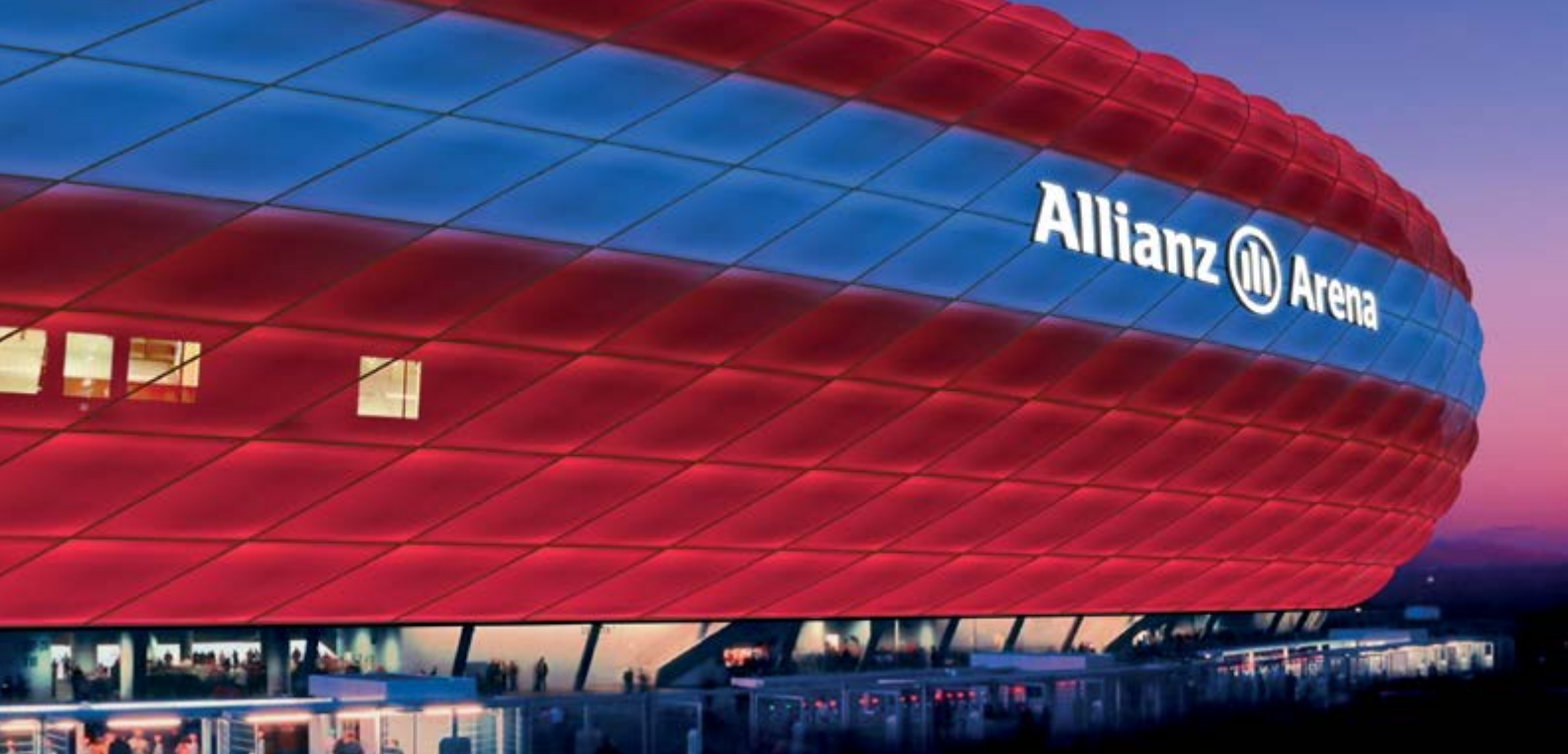
Estadio Allianz, Alemania (2015. Proyecto)

“ Los pabellones ahorran en costes operativos generan nuevos ingresos convirtiéndose realmente en polivalentes...”