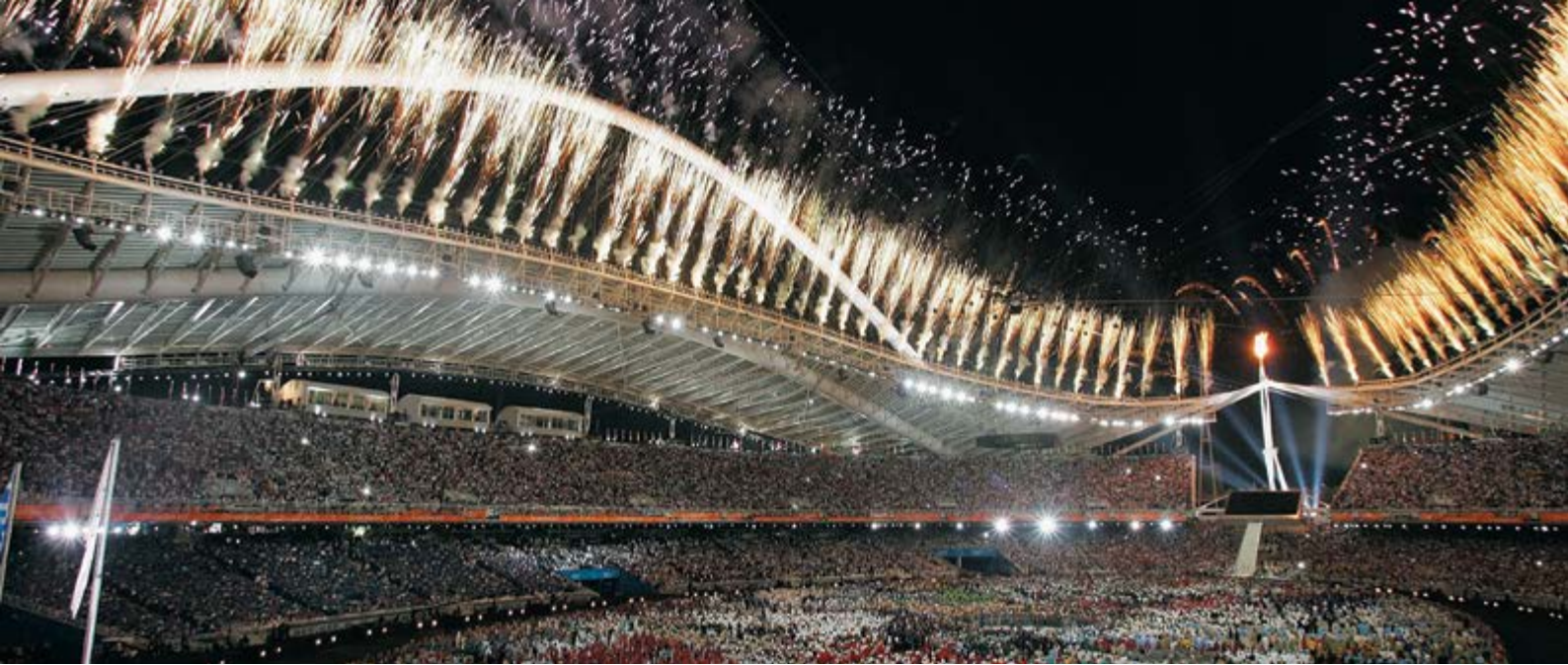
Juegos Olímpicos de Atenas 2004