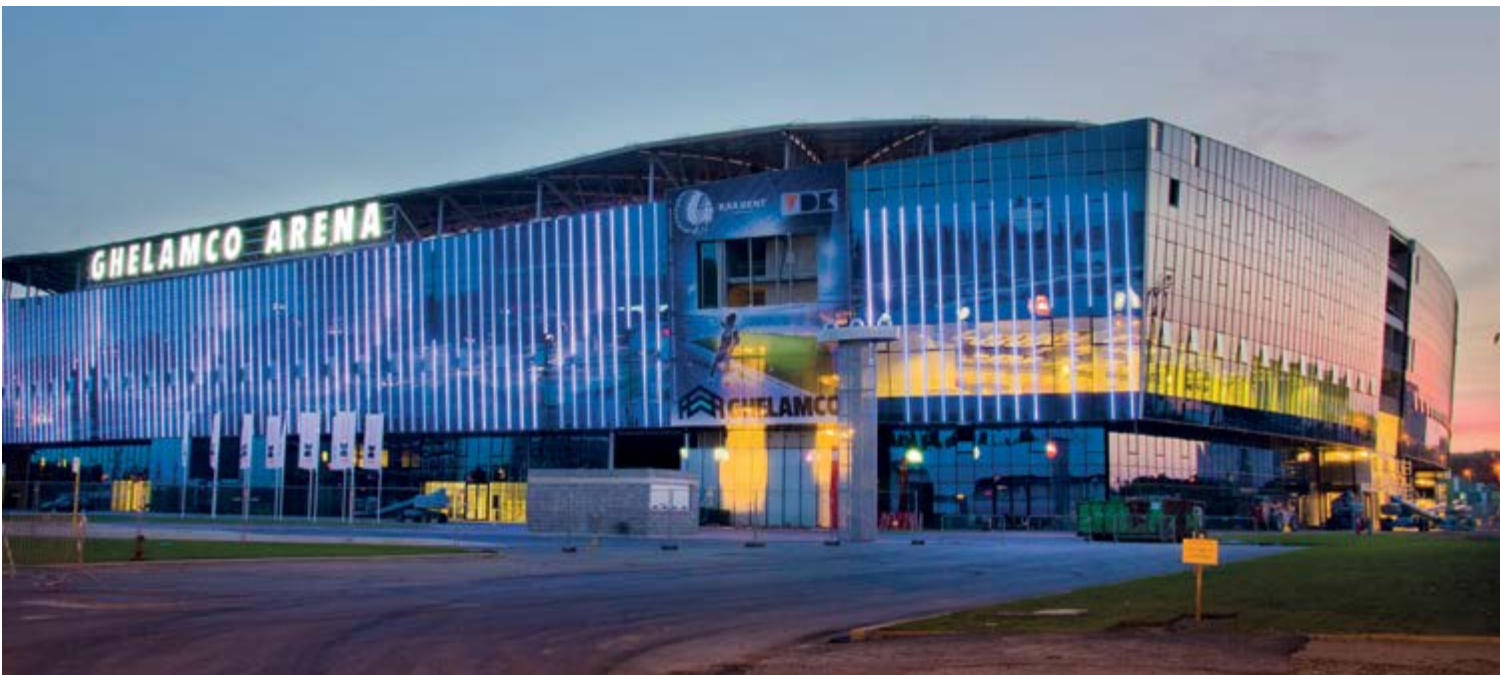
Estadio Ghelamco, Gante, Bélgica

Philips ofrece no sólo los productos, sino también el proyecto, asumiendo la responsabilidad del suministro e instalación de todo el sistema de iluminación, incluye tiendas y otras instalaciones, con un contrato de mantenimiento de 10 años subrayando así el elevado nivel de cooperación.