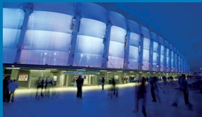
Estadio de la ciudad de Poznan, Polonia