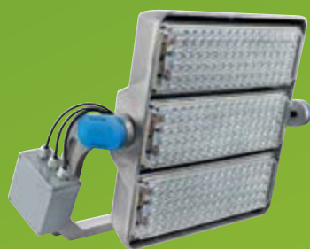
ArenaVision LED con caja de conexión