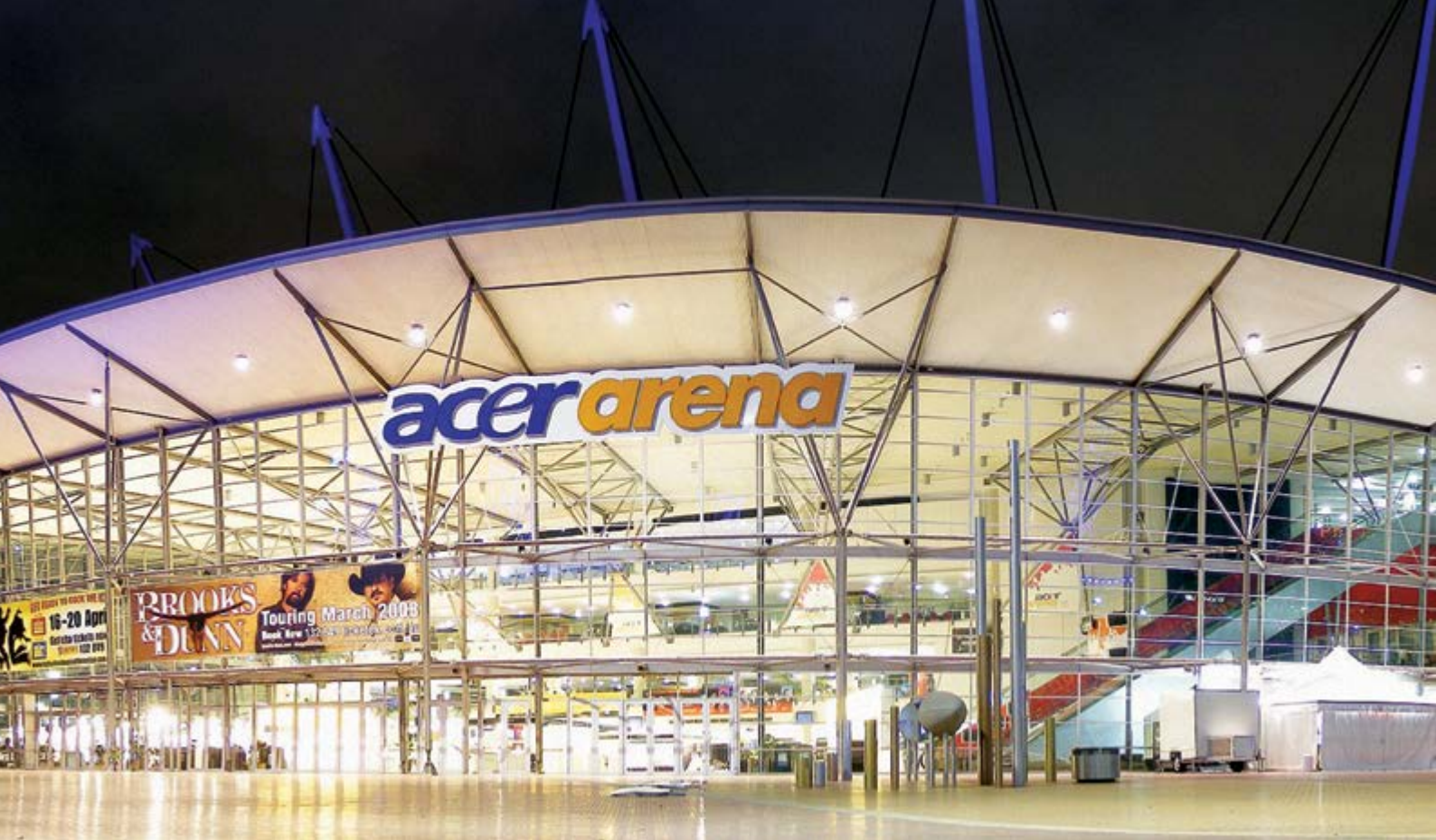
Estadio Acer, Sidney, Australia