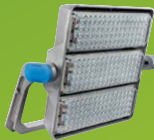
Sistema ArenaVision LED