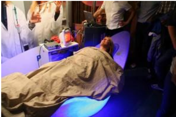
Wegdromend in de Alphasphere

De stoel stond naast de trap op de vierde verdieping in het NEMO met een ring van belangstellenden er omheen, overall was licht en geluid en drukte, dus ik vroeg me af of de stoel me echt zo tot rust zou kunnen brengen. Ik ben dol op het strand; ik kan urenlang zonnebaden zonder er zat van te worden. Eventjes wegdoezelen in het zonnetje is een van mijn favoriete dingen in de wereld... maar het is zo iets anders dan wat je meemaakt op een drukke beurs dat ik er weinig van geloofde.