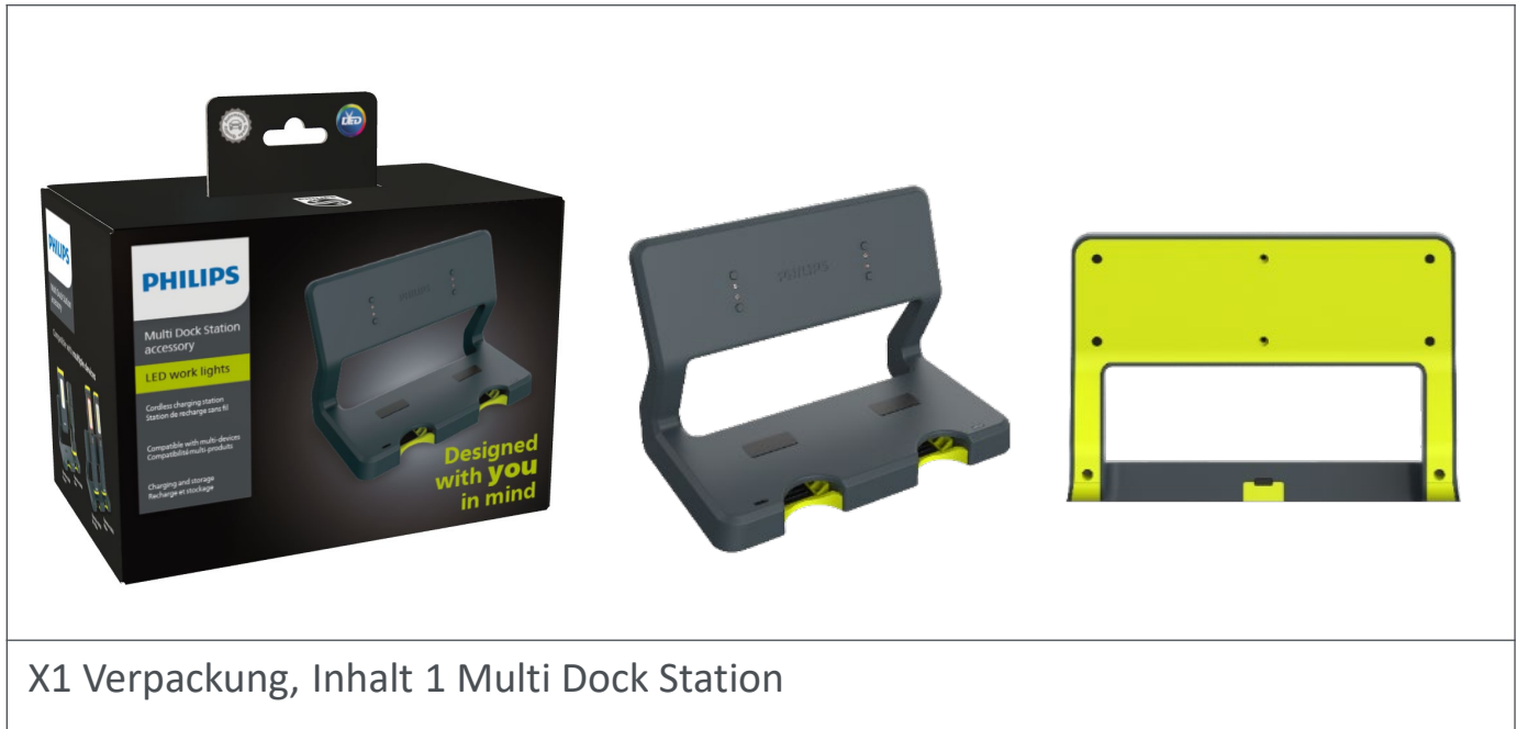
X1 Verpackung, Inhalt 1 Multi Dock Station