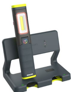
Xperion 6000 UV Pillar

*Die Xperion 6000 Multi Dock Station ist mit folgenden LED-Arbeitsleuchten kompatibel: