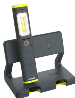
Xperion 6000 Pillar