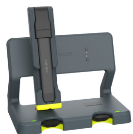
Xperion 6000 Slim