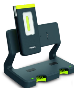
Xperion 6000 Pocket