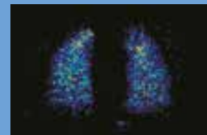
Ilman venttiileillä varustettua tilajatketta

Käytettäessä pelkkää sumutinta lääke päättyy usein suuhun, nieluun ja vatsaan. OptiChamber Diamond auttaa toimittamaan suuremman osan lääkkeestä keuhkoihin, jolloin hoito tehostuu. 2