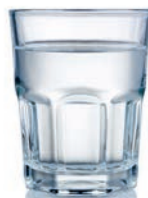
water for the milk