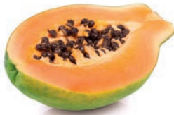
papaya / banana