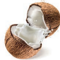
unsweetened coconut milk