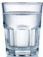
water for soaking