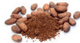
pure cacao powder