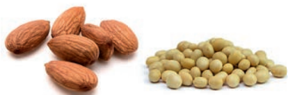
almonds / soy beans (dry)