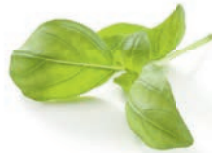
fresh basil leaves