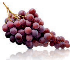
bunch of red grapes