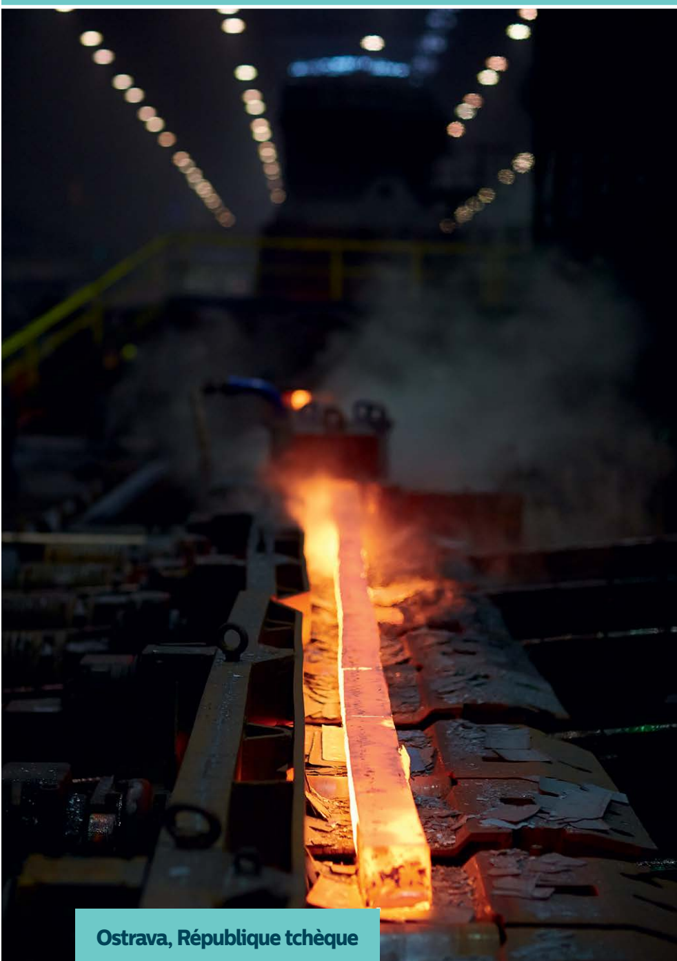
Ostrava, République tchèque

Philips Lighting Capital se félicite d'être arrivée à un accord qui a permis à ArcelorMittal de procéder à une modernisation plus que nécessaire de l'éclairage avec une période d'amortissement attractive et un plan d'éclairage durable.