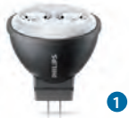
MASTER LEDspot 3,5W