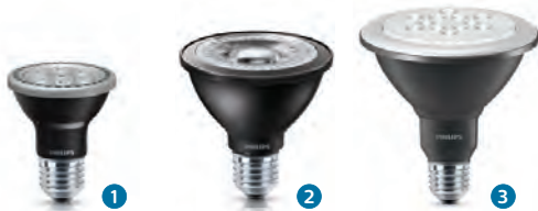
MASTER LEDspot PAR20 Dim MASTER LEDspot PAR30S Dim MASTER LEDspot PAR38 Dim