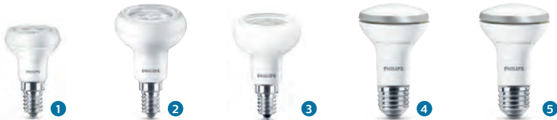
CorePro LEDspot R39 CorePro LEDspot R50 CorePro LEDspot R50 Dim CorePro LEDspot R63 NonDim/Dim CorePro LEDspot R80