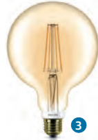
Classic LEDbulb gold Dim 7-50/55W ST64