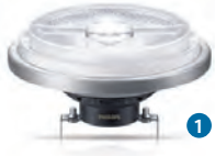
MASTER LEDspot AR111 11W/15W/20W