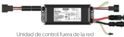
Unidad de control fuera de la red