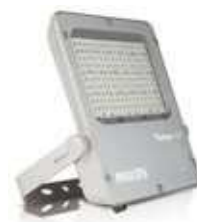
Tango G2 BVP281 4400-13 200 lm

*Nota: ETE significa extensión de tiempo de ejecución