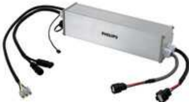
Unidad de control híbrida