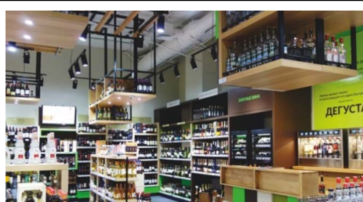
Sklepy z upominkami / spożywcze