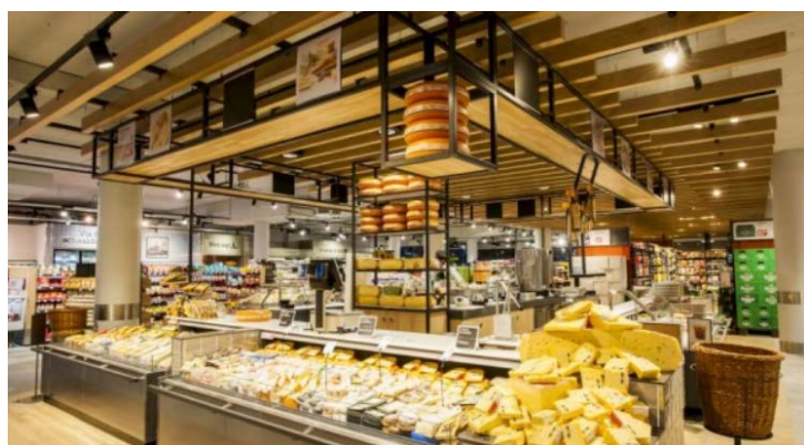
Obszary handlu żywnością