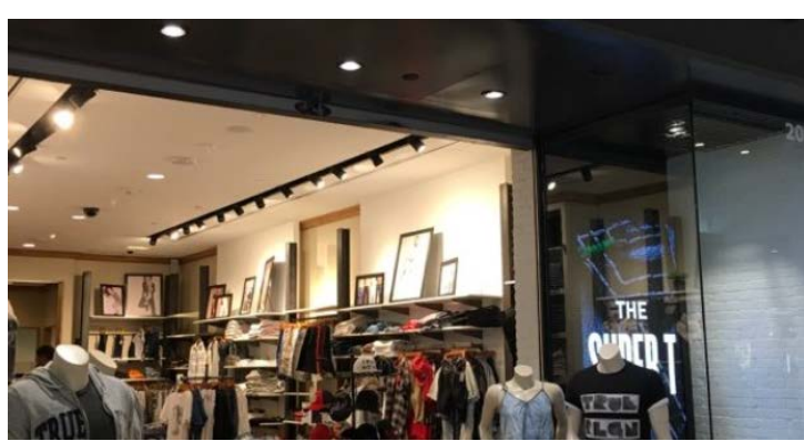
Małe sklepy z modą