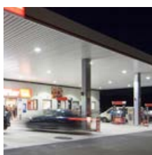
Iluminación zona marquesina, Mini 300 LED gen2