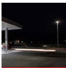
Iluminación zona perimetral, Luma