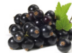
black currants cassis