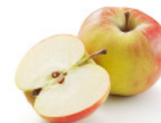
red apple pomme rouge