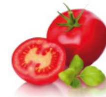
big tomatoes grosses tomates