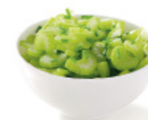
celery stalks branches de céleri