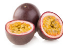
passion fruit fruit de la passion