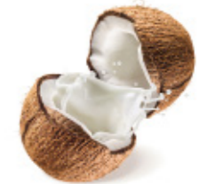
unsweetened coconut milk lait de coco non sucré