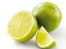
lemons or limes citrons jaunes ou verts