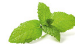
bunch of mint bouquet de menthe