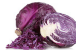
red cabbage chou rouge