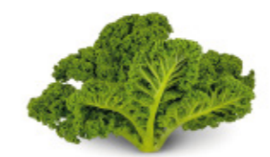
kale leaves feuilles de chou kale