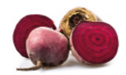
beet root betterave