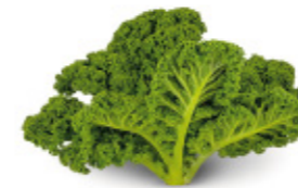
kale leaves feuilles de chou kale