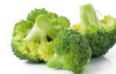
broccoli florets fleuettes de brocoli