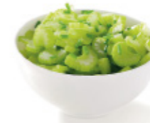
stick celery branche de céleri