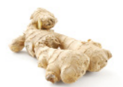
ginger morceau de gingembre