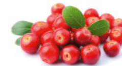
cranberries (fresh) canneberges (fraîches)