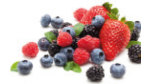
mixed berries mélange de fruits rouges