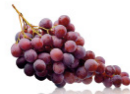
purple grapes raisin noir