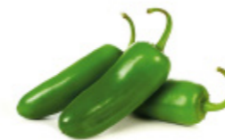
jalapeño pepper petit piment vert