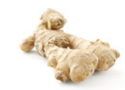
fresh ginger gingembre frais