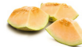
honey melon melon de miel (honeydew)