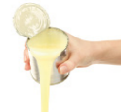
condensed milk lait concentré