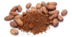
pure cacao powder poudre de cacao amer