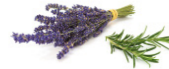
fresh lavender blossoms or rosemary fleurs de lavande ou de romarin