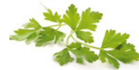
bunch parsley bouquet de persil