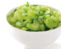
large stalk celery grandes branches de céleri