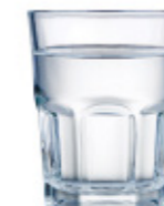
water for soaking d'eau pour le trempage