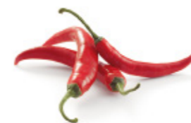
chilli pepper piment