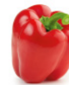
red bell pepper poivron rouge