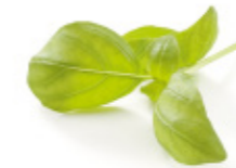
fresh basil leaves feuilles de basilic frais