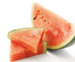
water melon pastèque