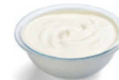
plain yogurt yaourt nature