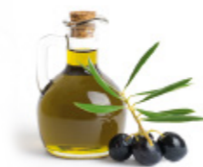
olive oil d'huile d'olive