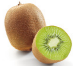
kiwi fruits kiwis