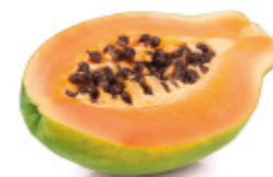
papaya / banana papaye / banane