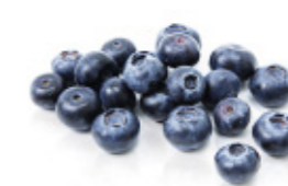
fresh blueberries myrtilles fraîches