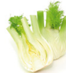
piece of fennel bulbe de fenouil