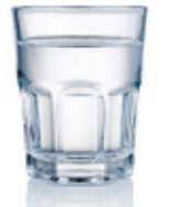
mineral water d'eau minérale