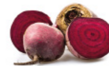
beet roots betteraves