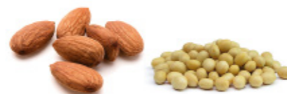
almonds / soy beans (dry) amandes / graines de soja (sèches)