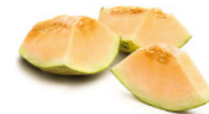
honey melon melon de miel (honeydew)