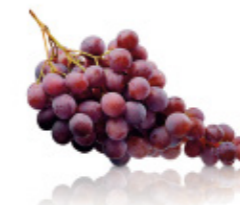
bunches of red grapes grappes de raisin rouge