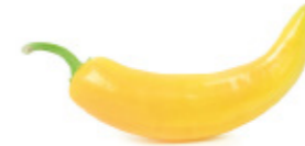
yellow pepper poivron jaune